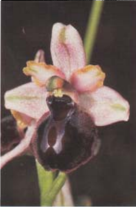
Fig. 3. Ophrys passionis arachnitiforme. Sierra de la Demanda (Castille-León, Espagne), 17.VI.1994.

Cependant, la conspécificité des populations italiennes et espagnoles a été mise en doute avec raison (BUTTLER 1986; DEVILLERS-TERSCHUREN & DEVILLERS comm. pers.). En effet, bien que morphologiquement proche d' O. garganica , le taxon occidental s'en distingue notamment par la structure des pétales, en moyenne bien moins larges, une coloration générale plus terne et une propension beaucoup plus grande qu' O. garganica à montrer des individus arachnitiformes; il se sépare d' O. sphegodes notamment par la structure du labelle, la couleur très sombre du champ basal et de la cavité stigmatique, brun rougeâtre clair chez O. sphegodes , ainsi que par une floraison plus tardive de 2 à 6 semaines. Ce taxon occidental a été distingué par ARNOLD (1981) comme espèce indépendante, sous le nom, malheureusement invalide, d' O. passionis SENNEN (voir aussi DELFORGE 1994A: 425).