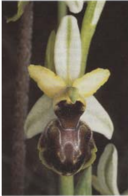
Fig. 2. Ophrys castellana . Sierra de Andia (Navarre, Espagne), 7.VI.1993.

Une première clarification s'opéra grâce à GÖLZ et REINHARD (1980), qui firent nettement la distinction entre morphes occasionnels arachnitiformes, espèces liées au seul groupe d' O. sphegodes et taxons intermédiaires entre O. sphegodes s.l. et O. fuciflora ou O. crabronifera . DEVILLERS-TERSCHUREN et DEVILLERS (1988) déchiffrèrent plus tard la structure du groupe, composé, selon eux, de 10 espèces bien délimitées, réparties en taxons précoces, côtiers ou insulaires, dérivant soit uniquement d' O. sphegodes s.l., soit d' O. sphegodes s.l. et d' O. fuciflora s.l. ou d' O. crabronifera , ainsi qu'en taxons tardifs d'origine plus obscure, un dernier ensemble auquel fut rattaché O. castellana décrit à cette occasion.