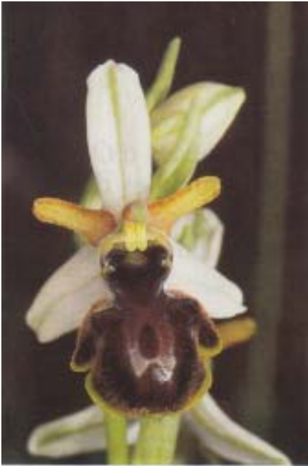
Fig. 1. Ophrys castellana . Sierra de la Demanda (La Rioja, Espagne), 9.VI.1993.

la macule est centrale, étendue, souvent complexe, bleu grisâtre brillant, bordée de blanc crème, en forme de H empâté, prolongé par des ramifications latérales; l'appendice est vert jaunâtre, très petit à bien développé, entier, triangulaire, dirigé vers le bas, inséré dans une échancrure nette; la cavité stigmatique est arrondie, brun noirâtre foncé, très étranglée sous les pseudo-yeux (DELFORGE 1994A: 418; Figs 1 & 2 in hoc op.).