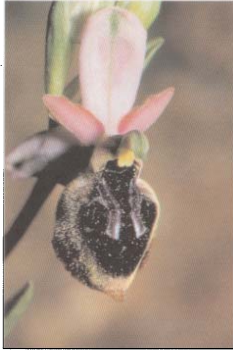
Fig. 2. Ophrys icariensis . Grèce, Cyclades, Naxos, 5.IV.1996.

Au vu des clichés illustrant la description et de deux diapositives fournies par H. SPAETH EN 1991, l'un d'entre nous est resté très perplexe lorsqu'il a dû insérer Ophrys icariensis dans un des groupes monophylétiques d' Ophrys (DELFORGE 1994A). Sur les quelques rares photographies disponibles alors, l'aspect des pétales et la pilosité marginale du labelle, parfois complète, pouvaient inciter à faire d' O. icariensis un membre du groupe d' O. bommuelleri . C'est l'option qui fut choisie en 1991, mais avec réserves, l'influence d' O. ferrum-equinum paraissant se dégager d'autres caractères floraux (DELFORGE 1994A: 343). Cette opinion n'est pas partagée par DEVILLERS et DEVILLERS-TERSCHUREN (1994) qui, tout en reconnaissant l'influence d' O. ferrum-equinum chez