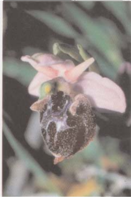
Fig. 1. Ophrys icariensis . Grèce, Cyclades, Naxos, 5.IV.1996.

villosa , Cistus monspeliensis et Quercus coccifera sur cailloutis de marbre qui n'avait pas retenu l'attention de l'un d'entre nous (PD) lors de son passage à la fin du mois d'avril 1994. Sur ce site, 3 orchidées étaient présentes en 1996: Serapias orientalis en début de floraison, Ophrys omegaifera déjà défleurie et une vingtaine de pieds d'un Ophrys en pleine floraison qui ne put être déterminé sur place.