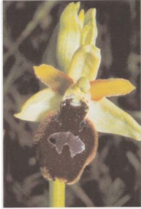
Fig. 2. Ophrys \times dekegheliana . ( O. bertolonii \times O. majellensis ). Italie, Latina, 6.VI.1984.

L'hybride se distingue aisément des parents par son stade de floraison et sa morphologie grosso modo intermédiaires. Plus précisément, il se sépare d' Ophrys bertolonii par ses sépales vert blanchâtre, ses pétales brunâtres relativement larges, à marge rouge ciliée, le labelle moins creusé en selle, la macule plus centrale, munie parfois de ramifications remontant jusqu'aux épaulements et, fondamentalement, par une cavité stigmatique de type O. sphogodes s.l., aussi large que haute et munie de parois latérales, alors qu'elle est plus haute que large et sans parois latérales chez O. bertolonii . L'hybride diffère d' O. majellensis notamment par la forme des pétales, le labelle plus convexe, légèrement en forme de selle, muni d'une pilosité marginale importante ainsi que par la macule centrale brillante et empâtée, qui rappelle celle du groupe d' O. bertolonii . Enfin, cet hybride se distingue des hybrides d' O. bertolonii avec O. sphogodes s. str., O. garganica ou encore O. incubacea notamment par une floraison plus tardive, une taille plus élevée et des fleurs plus grandes.