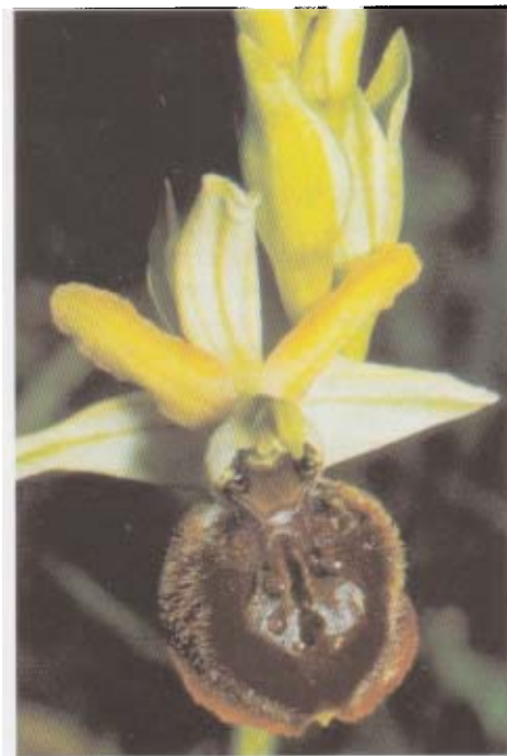
Fig. 1. Ophrys majellensis . Italie, Latina, 6.VI.1984.

Même dans le petit groupe d'espèces affines formé par Ophrys incubacea , O. garganica , O. sipontensis et O. passionis , l' Ophrys de la Maiella se distingue par un ensemble de caractères morphologiques particuliers, notamment une taille élevée, un labelle en moyenne plus grand et une phénologie très tardive, puisqu'il fleurit en juin et en juillet sur des sites xériques de l'étage collinéen. Ce dernier caractère, qui a frappé tout ceux qui ont observé l' Ophrys de la Maiella, est équivalent à celui qui a permis de décrire et d'élever au rang spécifique d'autres Ophrys tardifs, comme, dans le complexe d' O. fuciflora , O. elatior (GUMPRECHT 1973; PAULUS 1996), O. tetraloniae (TESCHNER 1987) ou encore O. aegirtica (DELFORGE 1996) par exemple.