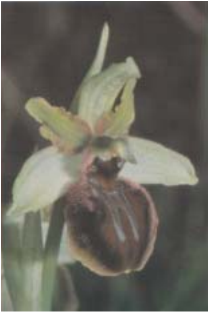
Planche 6. À gauche, en haut: Ophrys cf. lucentina . France, Pyrénées-Atlantiques, 16.III.1999; en bas: Ophrys sphegodes . France, Hérault, 25.IV.1999. À droite: Epipactis leptochila var. leptochila . France, Doubs. En haut: fleur correspondant bien à la description de GODFERY (1919), 4.VIII.1996; en bas: Individu exceptionnel muni de pédicelles floraux teintés de pourpre), 30.VII.1997.