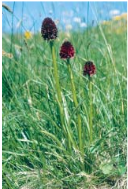
Planche 11. Gymnadenia rhellicani .

En haut , à gauche: G. rhellicani à labelle assez fermé par enroulement. Grèce, Drama, mont Phalakron, 22.VII.2003. En haut , à droite: G. rhellicani var. robusta à labelle assez ouvert. France, Savoie, Mont Cenis (loc. typ.), 25.VII.1999. En bas , à gauche: G. rhellicani ; individu intermédiaire entre la var. rhellicani et la var. robusta . Savoie, Cormet de Roselend, 26.VII.1999. En bas , à droite: groupe (clone ?) de 3 plantes G. rhellicani var. robusta , G. rhellicani var. rhellicani encadrant un individu intermédiaire. Savoie, Mont Cenis (loc. typ. de G. rhellicani var. robusta et de G. cenisia ), 22.VII.2002.