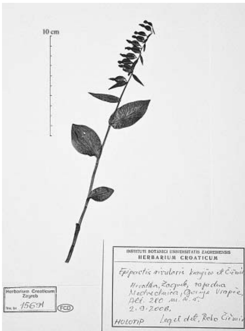
Fig. 1. Epipactis rivularis . Holotype.