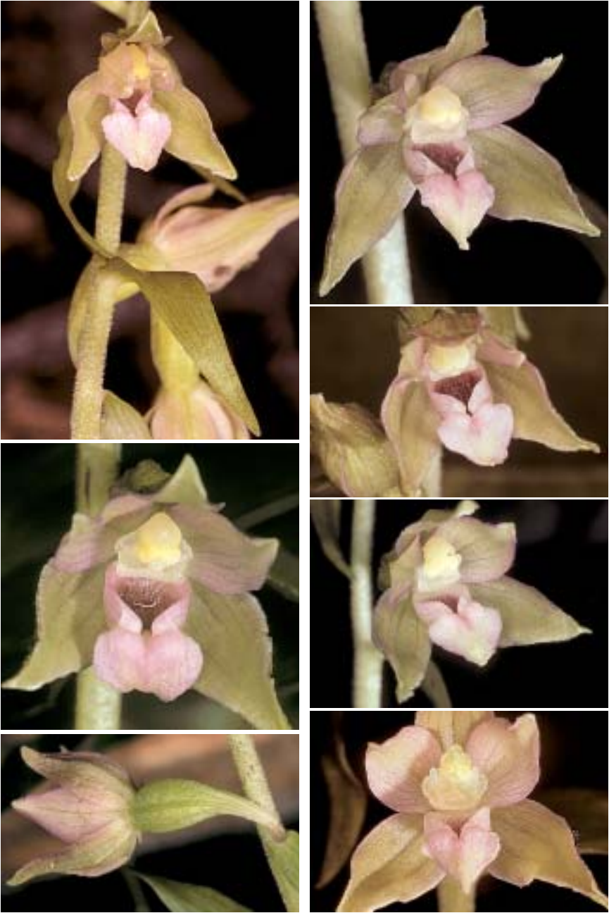
Planche 7. Epipactis rivularis . Croatie, Zagreb (loc. typ.), 31.VII.2006. L'épichile et les pétales sont nettement rosés; le sommet et les bords de l'épichile sont rabattus, la liaison épichile/hypochile étroite. Le clinandre réduit ne contient pas les pollinies peu cohérentes; la glande rostellaire est présente, les staminodes assez développés. La pilosité du rachis est bien visible (en haut à gauche), la couleur bronzée de la base du pédicelle floral aussi (en bas à gauche).