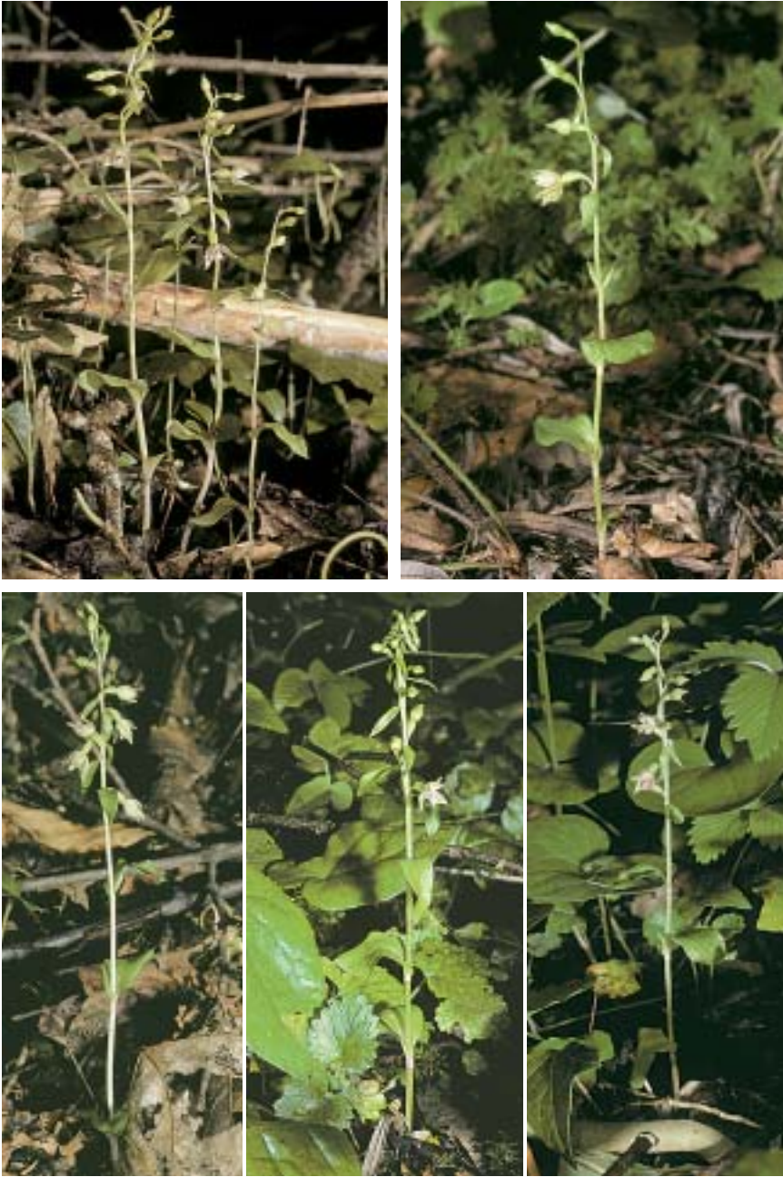
Planche 6. Epipactis rivularis . Croatie, Zagreb (loc. typ.), 31.VII.2006.

L'espèce forme rarement des groupes de tiges (en haut à gauche). La taille et le port sont plus proches de ceux d' Epipactis fibri que de ceux d' E. albensis , avec des feuilles courbées et souvent ondulées, dont la longueur égale fréquemment leur entrenœud respectif. Les fleurs sont subhorizontales à l'ouverture.