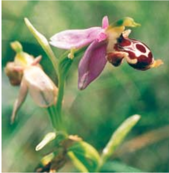
Fig 1. Ophrys minutula . Grèce, île d'Icaria, entre Xanthi et Ypapanti, 30 avril 2000.