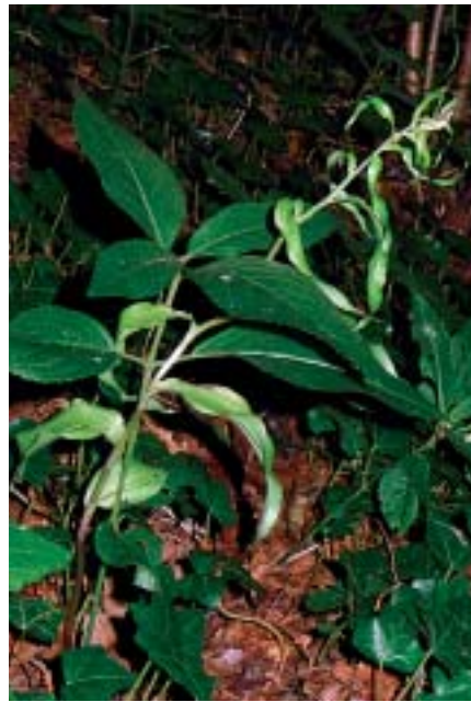
Planche 1. Epipactis leptochila à Awagne (Dinant, province de Namur).

En haut à gauche: groupe de 4 tiges en début de floraison, 4.VII.2009; à droite : groupe de 3 tiges en fleurs, site 1, 24.VII.2013. En bas à gauche: inflorescences, site 1, 20.VII.2013; à droite: tige isolée portant 6 boutons floraux qui vont dégénérer, site 2, 12.VII.2013.