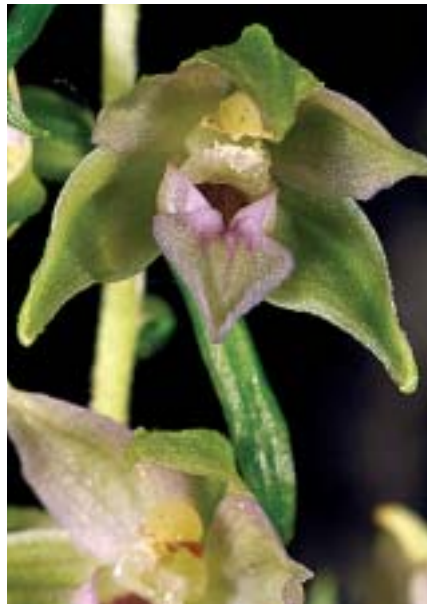
Planche 2. Epipactis leptochila à Awagne, 24.VII.2013 (Dinant, province de Namur). Toutes les fleurs: hypochile hémisphérique, autogamie (pollinies pulvérulentes, pas de glande rostellaire), jonction hypochile/épichile en V assez étroit. En haut à gauche: sommet de l'épichile ± rabattu sans torsion; à droite: avec ébauche de torsion asymétrique. En bas , à gauche: fleur assez peu ouverte, épichile rose étalé (noter la couleur verdâtre de la base du pédicelle floral, indiqué par une flèche); à droite: fleur assez âgée, campanulée, épichile étalé avec les bords réfléchis "en cuillère".