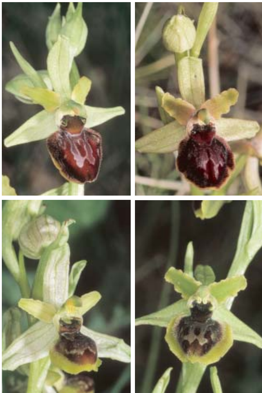
Planche 8. Ophrys sphegodes et O. virescens en Provence. En haut à gauche: Ophrys sphegodes . Vaucluse, La Bégude, 12.V.2001. En haut à droite et en bas: Ophrys virescens . En haut: Bouches-du-Rhône, Mont Puget, 23.IV.1999. En bas à gauche: sépales et pétales colorés; labelle largement bordé de jaune; Bouches-du-Rhône, Pas de la Couelle, 13.V.2001; à droite; sépales et pétales verts; labelle largement bordé de jaune; Pont de Bayeux, Bouches-du-Rhône, 13.V.2001.