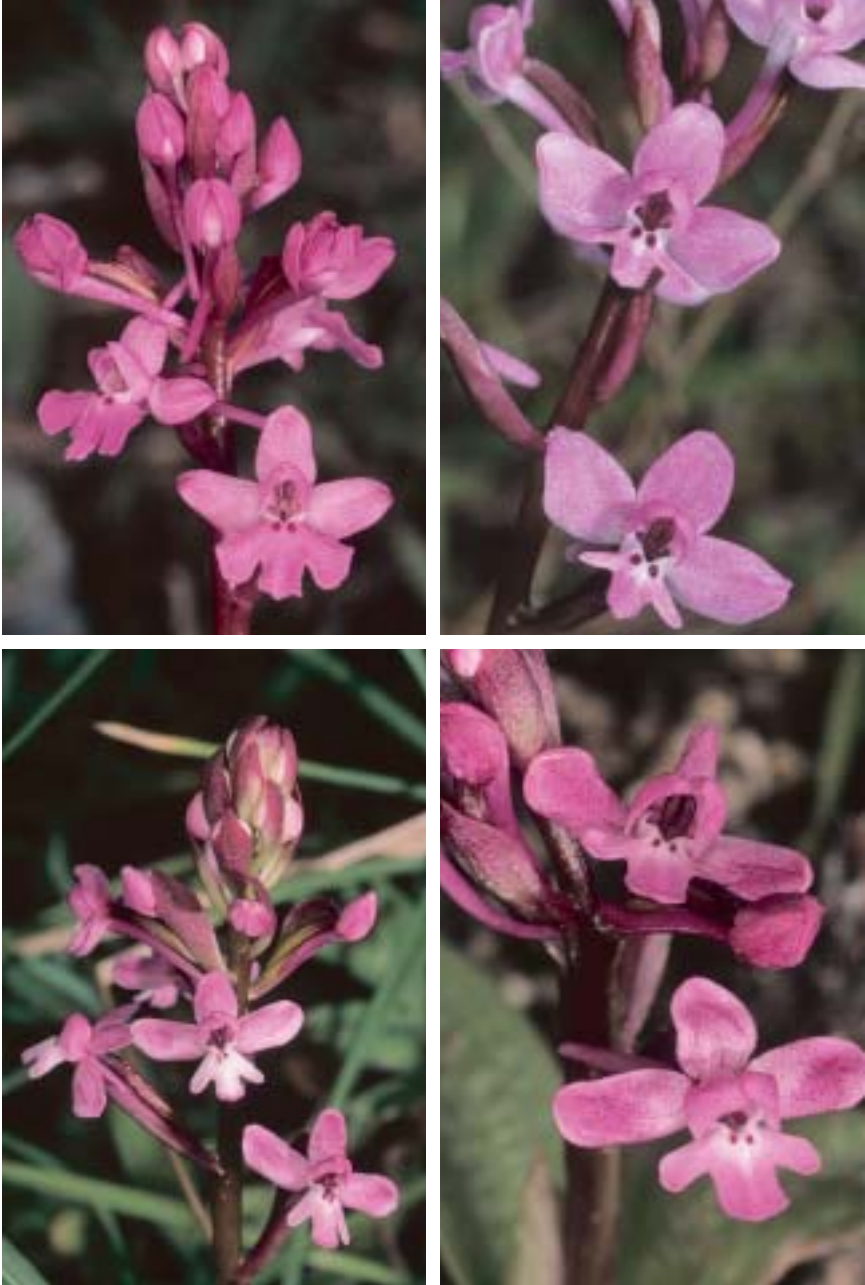
Planche 5. En haut, à gauche: Orchis quadripunctata . Italie, Calabre, Cosenza, mont Pollino, 10.IV.2002; à droite: O. brancifortii , Sicile, Messine, 29.IV.2000; en bas: O. brancifortii . Italie, Calabre, Reggio di Calabria, Stilo, 6.IV.2002. La position un peu différente des lobes latéraux du labelle chez les deux individus de la station calabraise est bien visible.