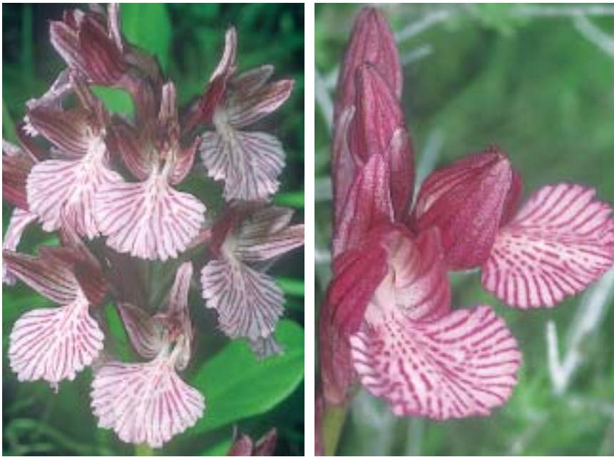
Planche 8. Orchis papilionacea en Crète.

À gauche: Orchis papilionacea var. heroica . En haut: avec O. papilionacea var. alibertis (à gauche). Rethymnon, Nithauris, 27.IV.2005; en bas: Lassithi, Lithines, 4.IV.2005. À droite: Orchis papilionacea var. alibertis . En haut (centre et droite): Rethymnon, Melambes, 23.IV.2005; en bas: Lassithi, Loutraki, 15.IV.2005.