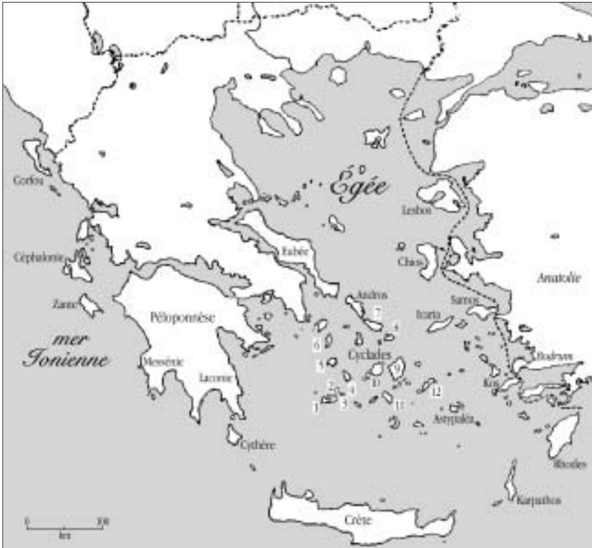
Carte 1. Le bassin égéen, la mer ionienne et les principaux toponymes cités dans le texte. Cyclades: 1. Milos; 2. Kimolos; 3. Polyaigos; 4. Siphnos; 5. Sériphos; 6. Kithnos; 7. Tinos; 8. Mykonos; 9. Naxos; 10. Paros et Antiparos; 11. Ios; 12. Amorgos.

Milos, Kimolos et Polyaigos (DELFORGE 1998; 2002), dans l'île d'Eubée (DELFORGE 1995C), ainsi que dans le Péloponnèse (par exemple DELFORGE 1996A) (Carte 1). Ces observations et d'autres, faites à Chypre (DELFORGE 1990), en Anatolie, en Grèce, dans l'île de Lesbos (DELFORGE in BIEL 1998), en Crète, en Épire et en Étolie-et-Acarmanie, dans les îles Ioniennes (par exemple DELFORGE 1992, 1993, 1994C), ainsi que plus à l'ouest en Croatie (DELFORGE 2005A), en Italie (par exemple DELFORGE 2003) ou encore en France (par exemple DELFORGE 1996B) et dans la péninsule ibérique (par exemple DELFORGE 2004A), ont abouti à proposer des changements de rang taxonomique pour plusieurs taxons, par exemple S. apulica (DELFORGE 1990: 110), S. carica (DELFORGE 1994B: 209), S. orientalis var. siciliensis (DELFORGE 2000: 398), S. cordigera var. cretica (DELFORGE 2004B: 252) ou la description de taxons nouveaux, S. aphroditae (DELFORGE 1990: 113), S. carica var. monantha (DELFORGE 1999: 419) et S. elsae (DELFORGE 2004A: 106).