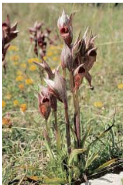
Planche 1. Serapias orientalis dans le bassin égéen.

En haut à gauche: Serapias orientalis var. orientalis . Crète, Heraklio, 6.IV.2005; à droite S. orientalis var. carica . Cyclades, Amorgos, 16.IV.1997. En bas à gauche: S. orientalis var. monantha . Cyclades, Andros, 10.IV.1994; à droite: S. orientalis var. sennii . Péloponnèse, Messénie, 21.IV.1991.