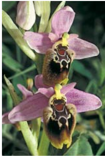
Planche 1. Ophrys x lambrechtsiana et ses parents. (Île de Cythère, Attique, Grèce)

Les parents. en haut : Ophrys cytherea . Valadia, 2.IV.2010; Meringaris, 3.IV.2010. En bas , à gauche: O. amphidami . Makrykythira, 2.IV.2010. L'hybride: à droite: O. x lambrechtsiana (holotype). Valadia, 2.IV.2010.