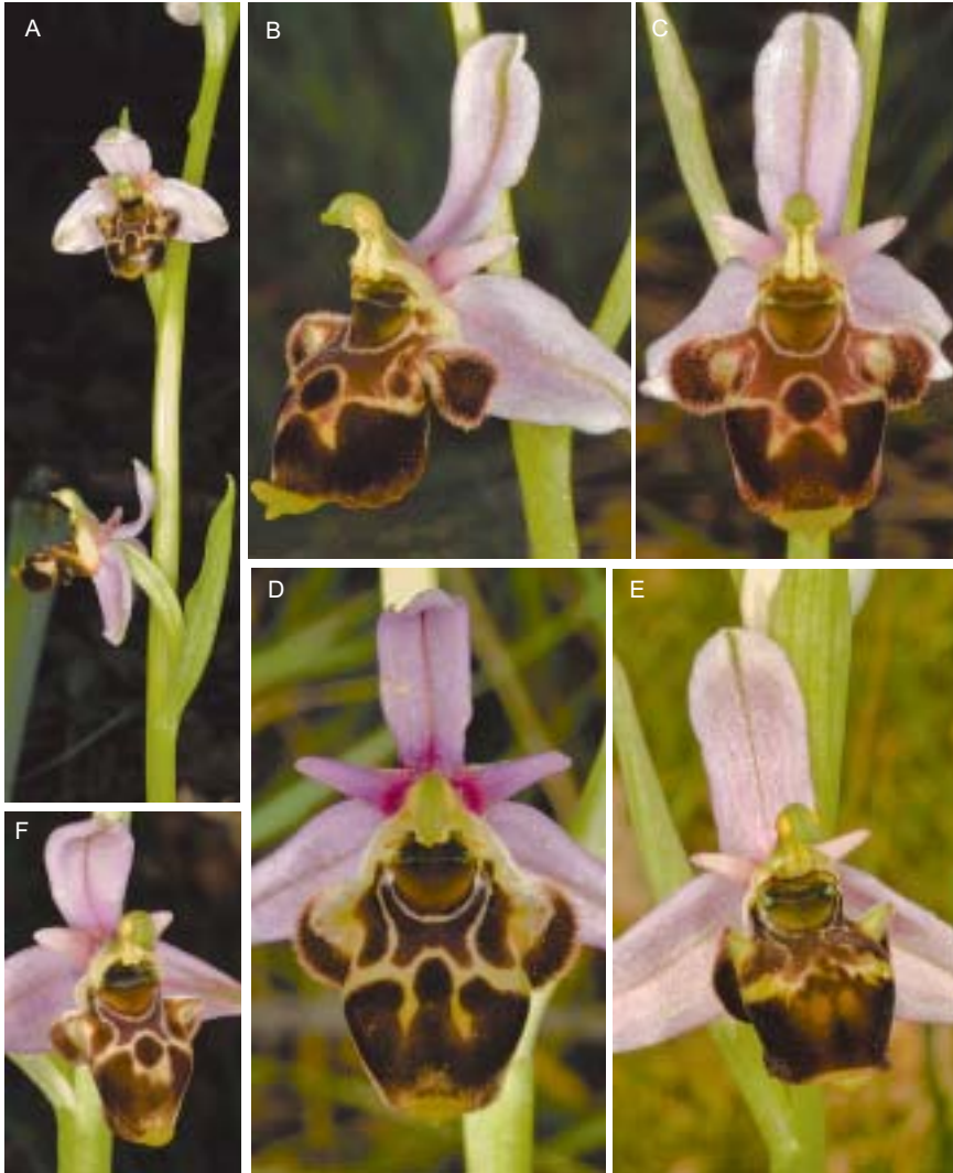
Planche 2. Ophrys quercophila . Hérault, Fontanès (site 19), 12.V.2017.

A. Fleurs petites (longueur labelle: 9,5 mm); labelle massif vu de face, scolopaxoïde de profil, lobe médian peu enroulé. B-C. Vues de profil et de face d'une fleur assez grande (longueur labelle: 13 mm); B. profil nettement scolopaxoïde; C. labelle massif vu de face, lobe médian peu enroulé, cavité stigmatique à parois latérales verticales, raccord à angle droit des lobes latéraux. D. Fleur assez grande (longueur labelle: 15 mm); labelle massif, cavité stigmatique peu dégagée de la base du labelle. E. Fleur petite (longueur labelle: 11,5 mm); labelle nettement scolopaxoïde, lobe médian peu enroulé; cavité stigmatique bien dégagée du labelle, son arrondi prolongé par le dessin du champ basal; raccord à angle aigu des lobes latéraux assez aigus. F. Fleurs petites (longueur labelle: 10 mm); labelle très scolopaxoïde; lobe médian court, mais peu enroulé, les bords récurvés; cavité stigmatique bien dégagée du labelle, son arrondi prolongé par le dessin du champ basal; raccord à angle aigu des lobes latéraux assez aigus.