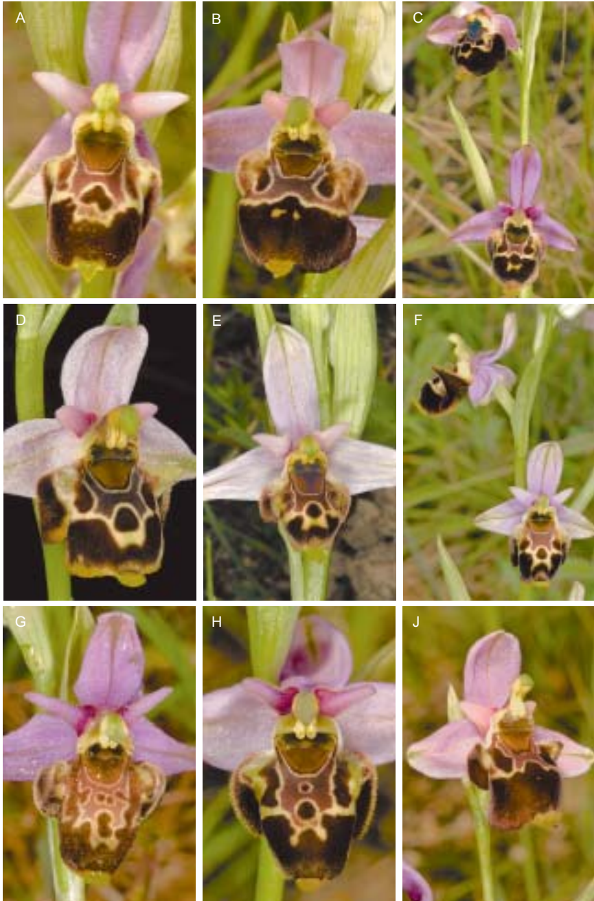
Planche 5. Ophrys quercophila . Drôme.

A. Salles-sous-Bois (site 9), 3.VI.2013. B. Combovin (site 10), 26.V.2016. C. Peyrus (site 11), 13.V.2012. D. Gigors (site 12), 24.V.2016. E. Monclar-sur-Gervanne (site 13), 18.V.2017. F. Gigors (Les Vignes, site 14), 27.V.2012. G. Beaufort-sur-Gervanne (site 15), 29.V.2013. H-J. Rochefort-Samson (Saint-Genis, site 17). H. 7.VI.2013. J. 6.VI.2014.