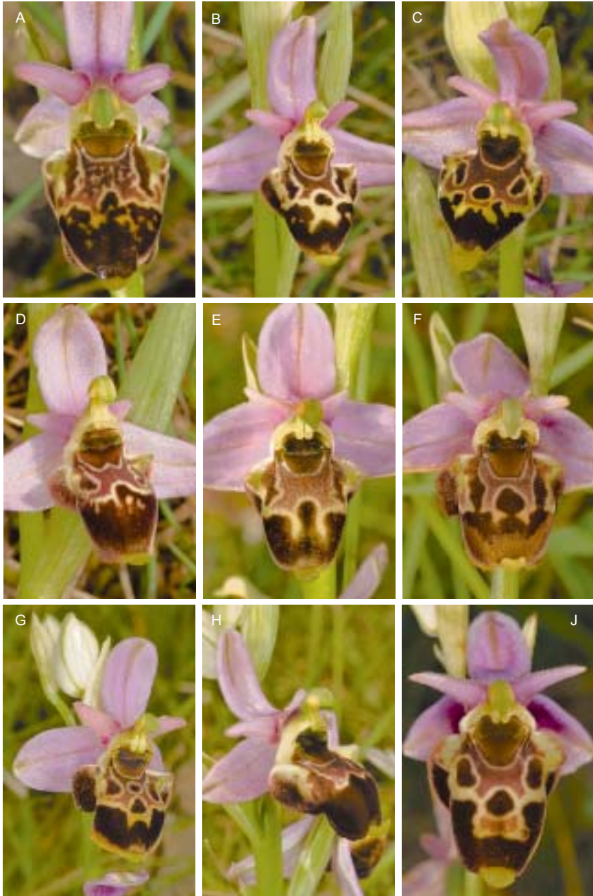
Planche 4 Ophrys quercophila . Ardèche.

A. Montaigu (site 2), 13.V.2017. B. Rochecolombe (site 3), 13.V.2017. C. Gras (site 5), 14.V.2017. D. Saint-Andéol-de-Berg (site 6), 10.V.2013. E. Saint-Pons (site 7), 14.V.2017. F. Saint-Pons (site 7), 5.VI.2013. G. Saint-Pons (site 7), 14.V.2017. H. Saint-Pons (site 7), 14.V.2017. J. Alba-la-Romaine (site 8), 5.VI.2013.