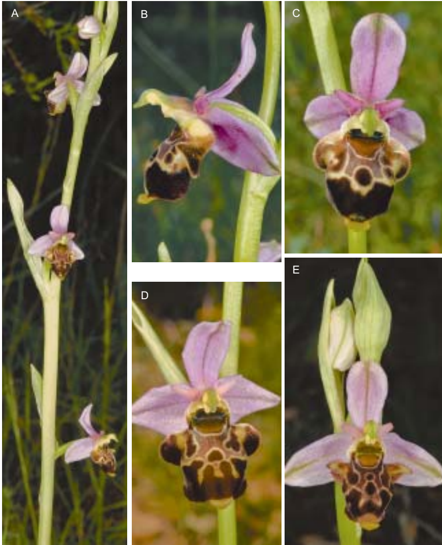
Planche 1. Ophrys quercophila . Hérault, Sauteyrargues (loc. typ., site 20), 12.V.2017.

A. Tige robuste, inflorescence lâche, grandes bractées, fleurs assez petites (longueur labelle: 10,5 mm); labelle scolopaxoïde mais lobe médian assez peu enroulé, les bords ne se touchant pas par dessous; cavité stigmatique assez peu détachée de la base du labelle. B-C. Vues de profil et de face d'une fleur assez grande (longueur labelle: 14,5 mm); B. profil nettement scolopaxoïde, bord et pilosité périphérique du lobe médian visibles; C. labelle massif vu de face, lobe médian peu enroulé, cavité stigmatique à parois très épaisses, divergentes à la base, se raccordant avec un angle très ouvert aux lobes latéraux du labelle (cf. aussi fig. 1). D. Fleur assez grande (longueur labelle: 15 mm); labelle massif, cavité stigmatique à parois latérales verticales, prolongées par la base rétrécie du labelle, celle-ci raccordée à angle droit aux lobes latéraux. E. Fleur moyenne (longueur labelle: 13,5 mm); labelle nettement scolopaxoïde, mais cependant lobe médian peu enroulé, à bords récurvés; cavité stigmatique bien dégagée du labelle, son arrondi prolongé par le dessin du champ basal; raccord à angle aigu avec les lobes latéraux plus effilés.