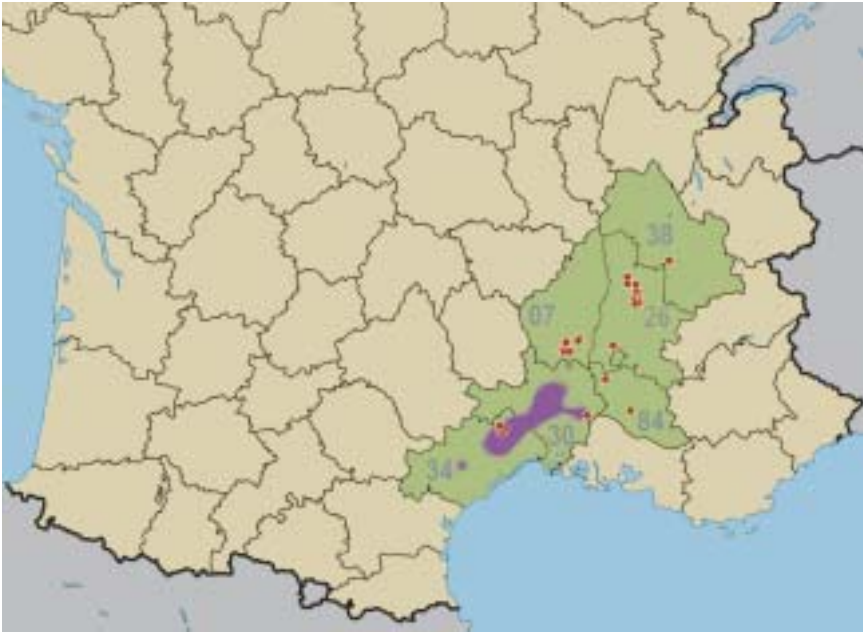
Carte 1. Sud de la France.

Points rouges: localisation des 25 sites décrits dans l'annexe et sur lesquels la présente étude s'appuie; en violet, aire d' Ophrys quercophila telle que délimitée lors de sa description (d'après NICOLE et SOCA 2017: 96, fig. 3, rectifié).