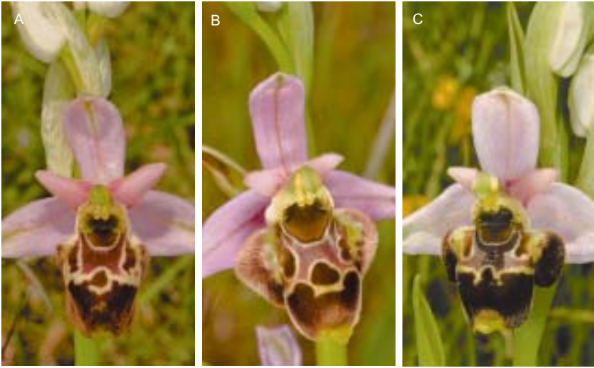
Planche 6. Ophrys quercophila . Isère et Vaucluse.

A. Isère, Châtelus (site 23, avec réserves), 31.V.1981. B. Vaucluse, Sérignan-du-Comtat (site 24), 4.VI.2013. C. Vaucluse, Fontanille (site 25), 3.VI.2013.